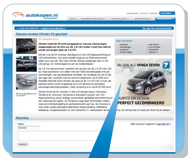
Voorbeeld rectangle op de nieuws-detailpagina