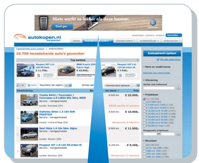
Voorbeeld leaderboard op de voorraad-overzichtspagina